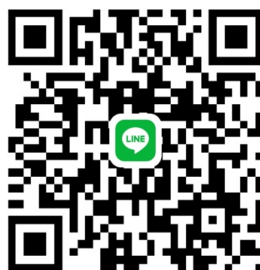
〈ステージ企画出展担当者連絡先〉